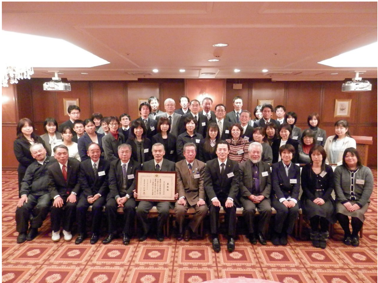
優良PTA文部科学大臣表彰受賞祝賀会 撮影：平成25年12月13日[グランラセーレ米子]

優良PTA文部科学大臣表彰受賞祝賀会が、平成25年12月13日、グランラセーレ米子で行われました。松萌会、體水会、教職員約50名が参加しました。