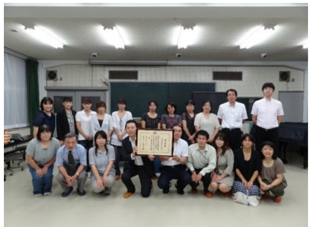
松萌会第2回総務委員会にて現役員の皆さんと